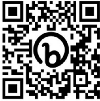
ขั้นตอนที่ 1